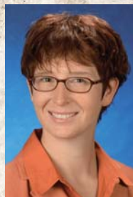
Gisela Stang Bürgermeisterin der Kreisstadt Hofheim am Taunus (Veranstalter)